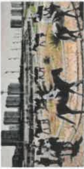
Uygulamalı Binicilik Dersi