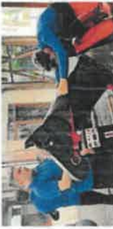
Mekanik At Çalışması