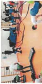
Beden Eğitimi ve Spor Dersi